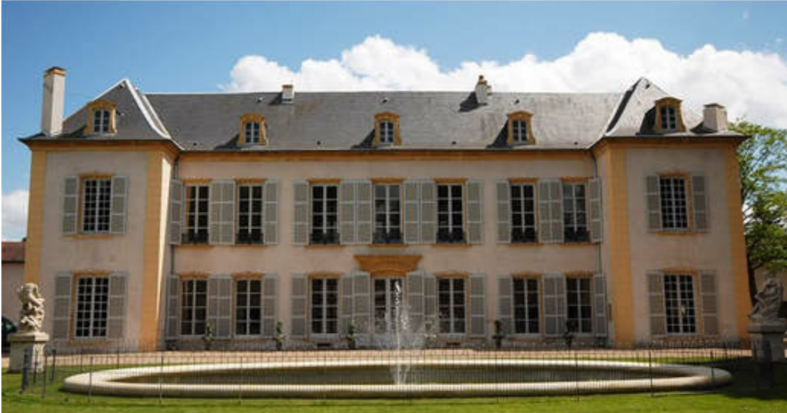
Le château de Courcelles.