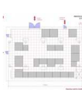
Saint Pierre aux Nonnains

Les 3 halls d'exposition à l'intérieur de l'Arsenal à Metz se présentent comme suit :